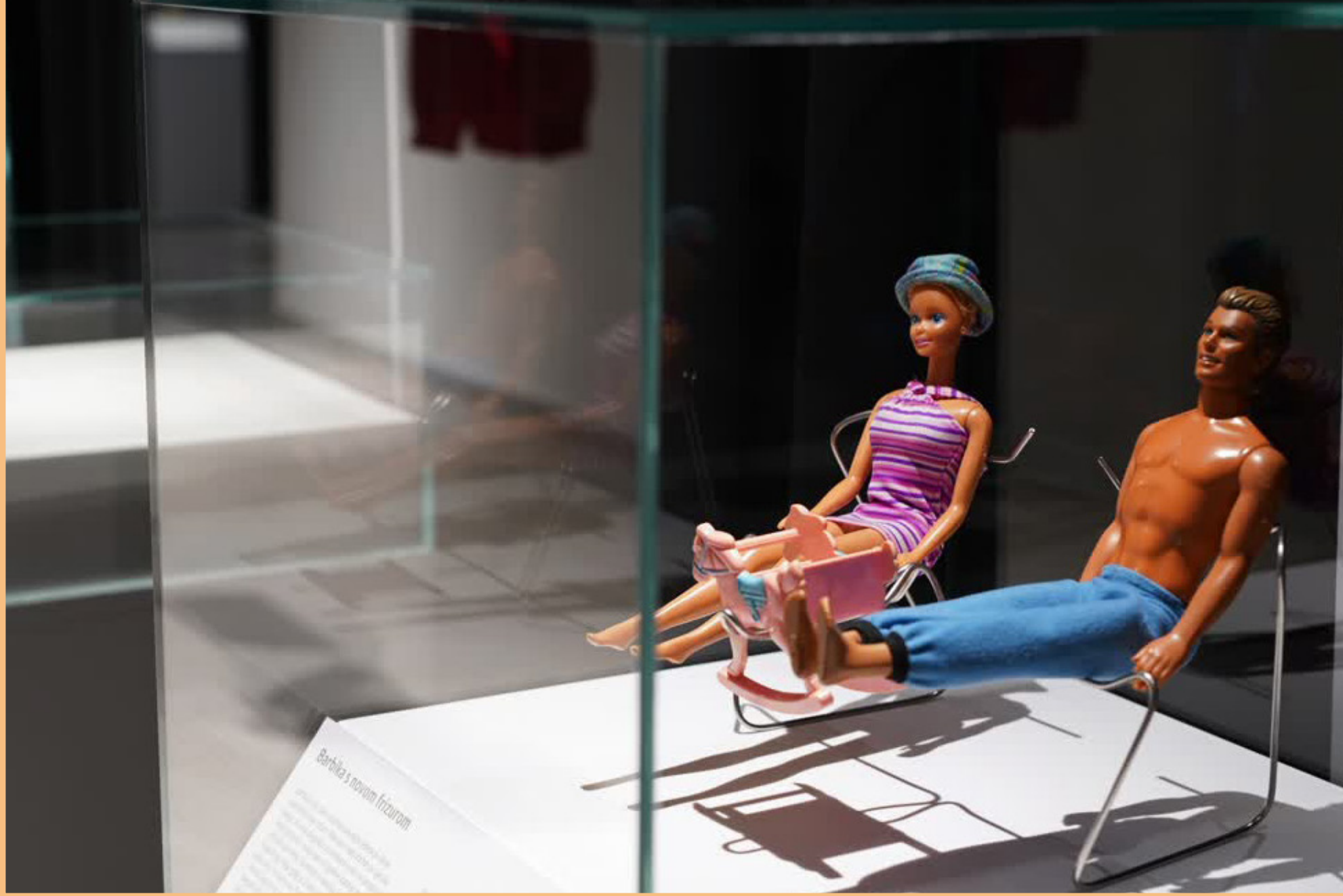
Muzej ratnog detinjstva, izložba, 2022.