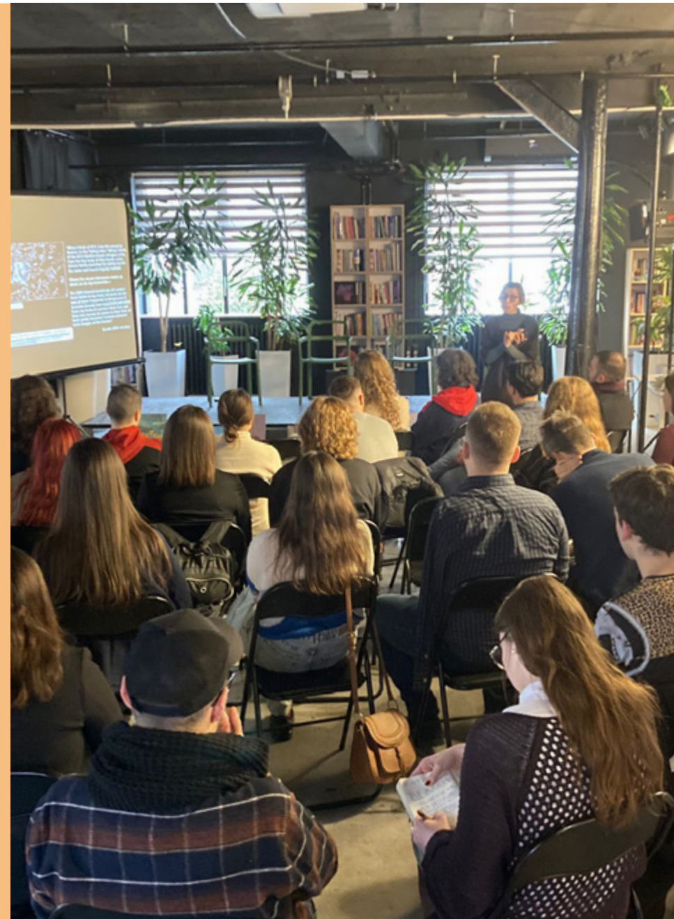
Program Važni smo mi

Uprkos političkim tenzijama, nesporazumima, međusobnim optužbama i odsustvu suštinske debate o jedinstvu i miru koji su obeležili odnose Srbije i Kosova, iako suočena sa izazovima vezanim za blokade na severu Kosova, tenzijama i bezbednosnim rizicima, Inicijativa je uspela da u ovom programu okupi 32 učesnika i učesnica sa Kosova i iz Srbije.