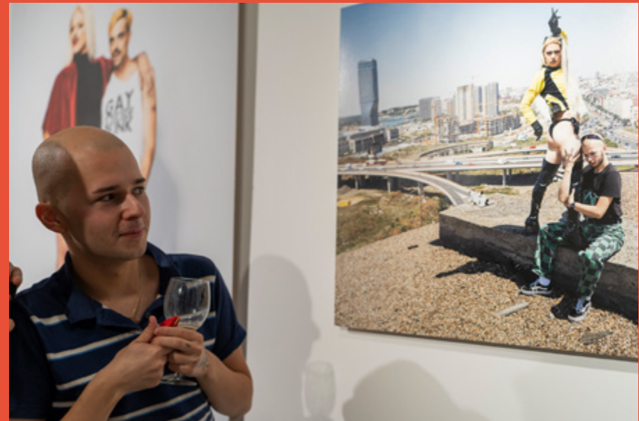
Kings & Queens, 2022