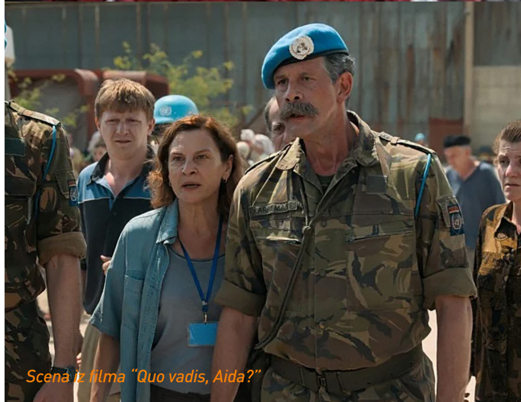
Scena iz filma “Quo vadis, Aida?”