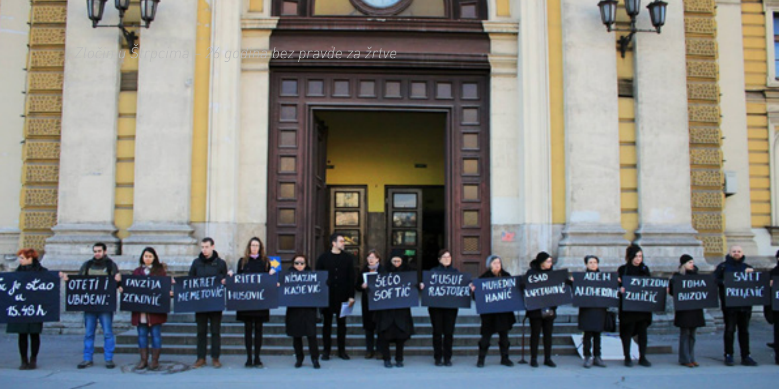
Akcija kod Glavne železničke stanice u Beogradu

Sudom Bosne i Hercegovine, priznao je krivicu i osuđen na kaznu zatvora u trajanju od pet godina.