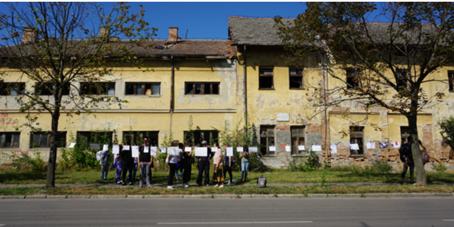
Akcija "Biblioteka sećanja" u Zrenjaninu