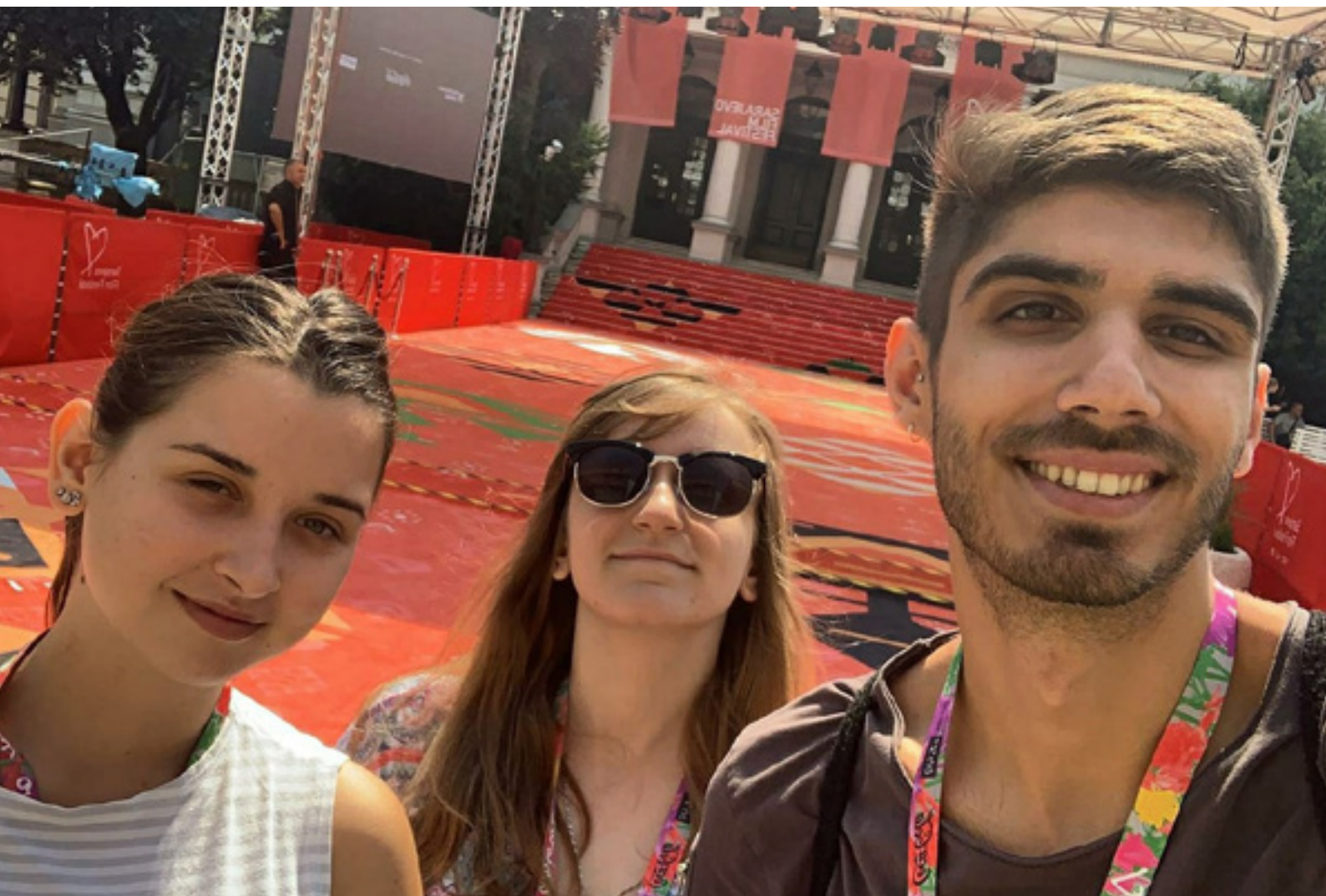
Aktivisti Inicijative na Sarajevo Film Festivalu

Kao i svake godine, aktivisti Inicijative na Sarajevo Film Festivalu učestvovali su u diskusijama organizovanim u okviru programa "Docu Corner".