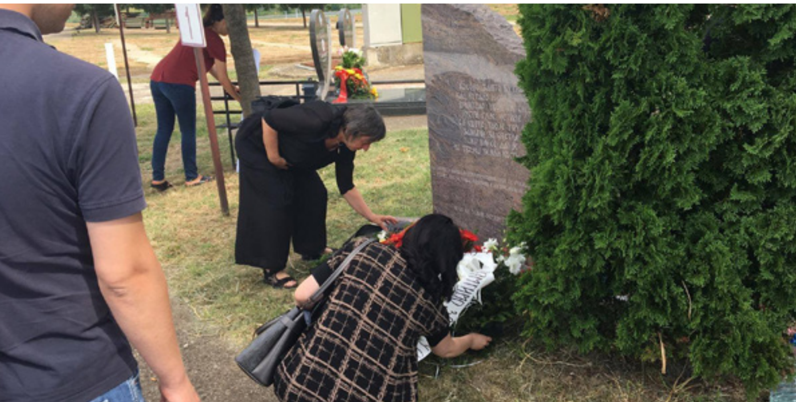
Polaganje cveća na groblju Orlovača

Na groblju Orlovača sahranjeni su posmrtni ostaci najvećeg broja žrtava, među kojima su članovi porodice Kostić i porodice Nikolić.