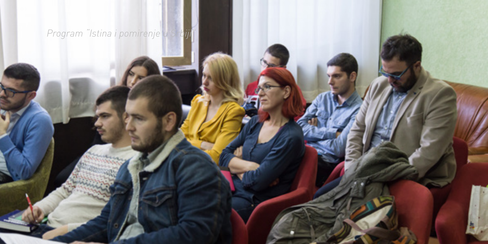
Radionica u Priboju

oblik torture i zlostavljanja od strane organa javne i tajne bezbednosti Republike Srbije u Sandžaku.