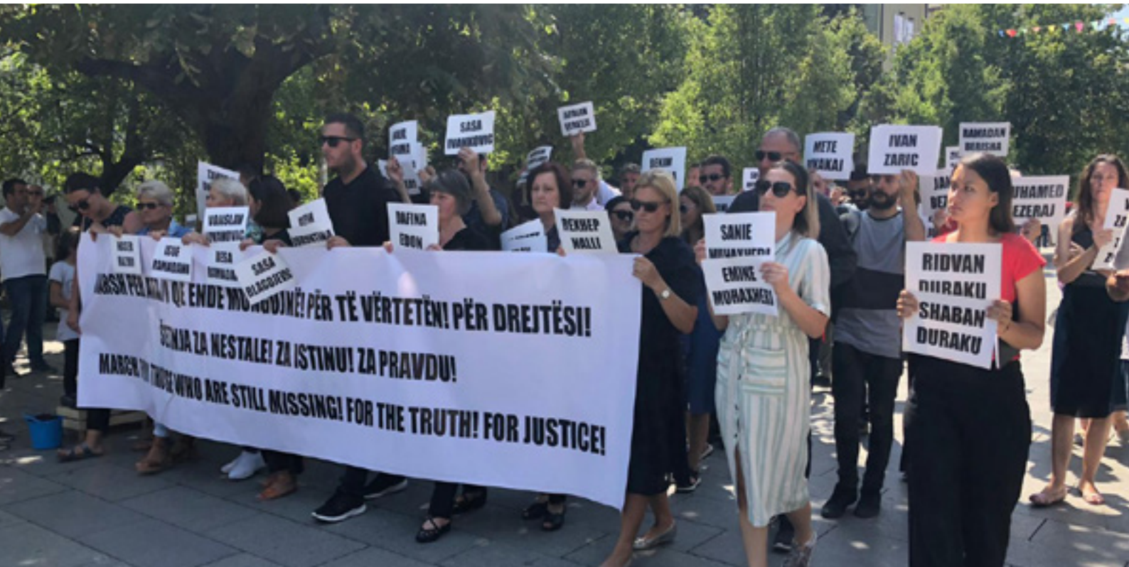
Gradani Prištine u protestnoj šetnji za nestala lica na Kosovu

Kosovsko i srpsko društvo ne mogu biti sposobni za postizanje trajnog mira ukoliko se zločini počinjeni tokom rata iskreno ne osude, a otvorena pitanja, uključujući i pitanje nestalih lica, ne budu rešena, poručila je Inicijativa mladih za ljudska prava na Kosovu.