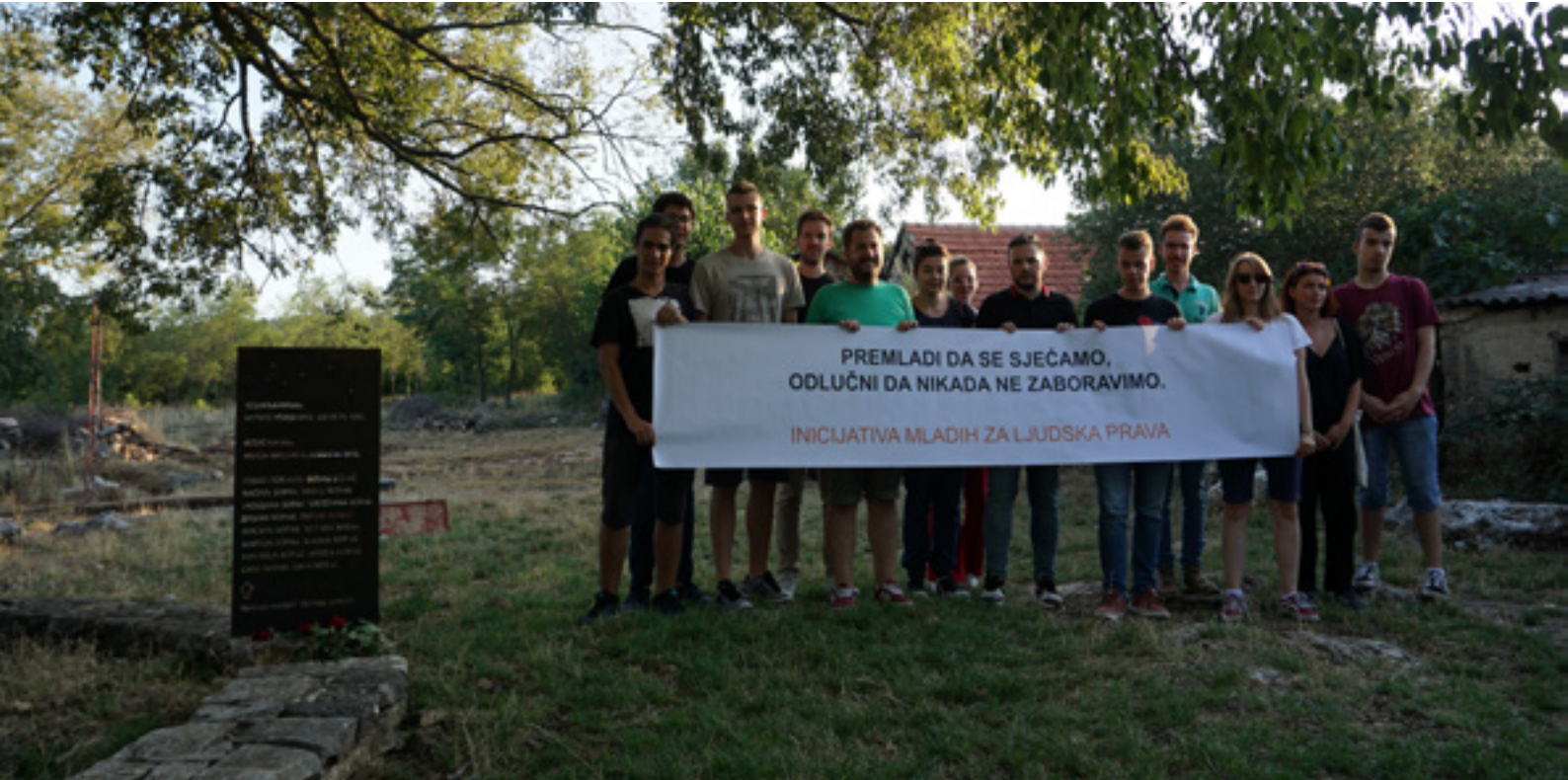
Aktivisti YIHR u mestu Gošić

Priznanje i procesuiranje zločina u Oluji od strane Republike Hrvatske, kao i puno zakonsko poštovanje ubijenih i izbeglih od Republike Srbije u interesu je oba društva koja imaju perspektivu jedino u miru.